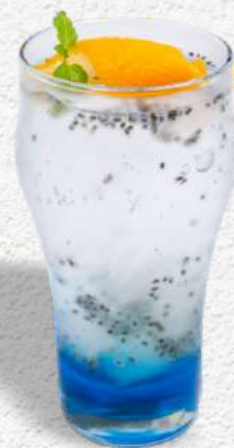
Ocean Blue Sky