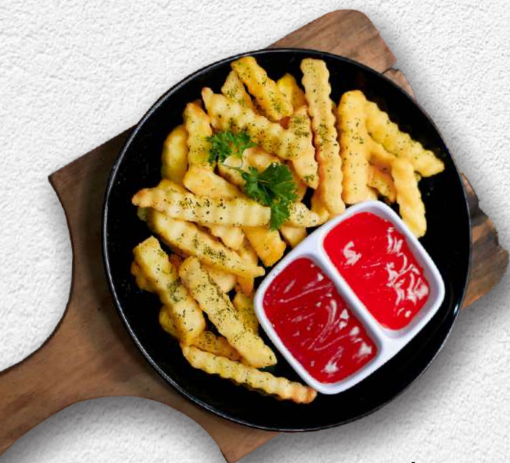
French Fries 25K